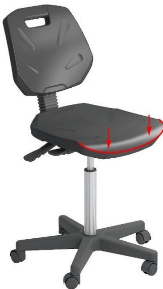
Рис. 1. Зона нагрузки на излом